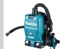
Adattatore Ø 38