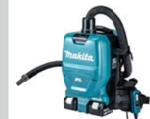
Adattatore Ø 22