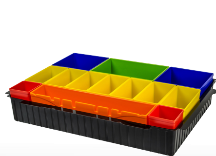
P-83652 Porta minuterie con inserti colorati