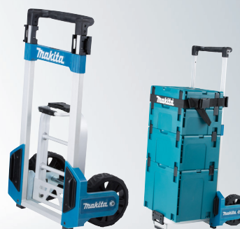
TR0000001 Carrello di trasporto fino a 9 valigette ( \varnothing ruote 20 cm)