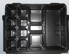
P-83674 Preformato 12 compartì