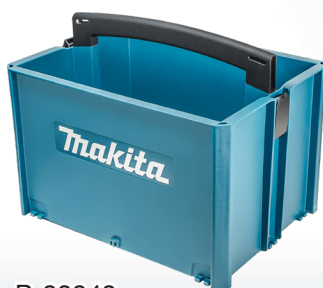
P-83842 Cestello portautensili 395x295x249mm