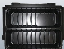
P-83680 Pref. doppio 6 compartì