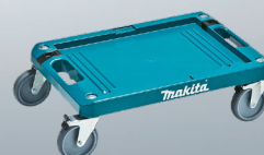
P-83886 Base di trasporto fino a 9 valigette (portata max 100 kg)