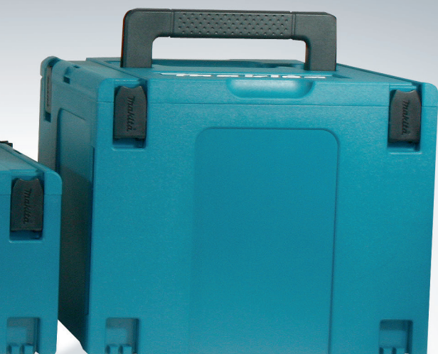
821552-6 (Tipo 4)