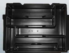
P-83668 Preformato a 5 compartì