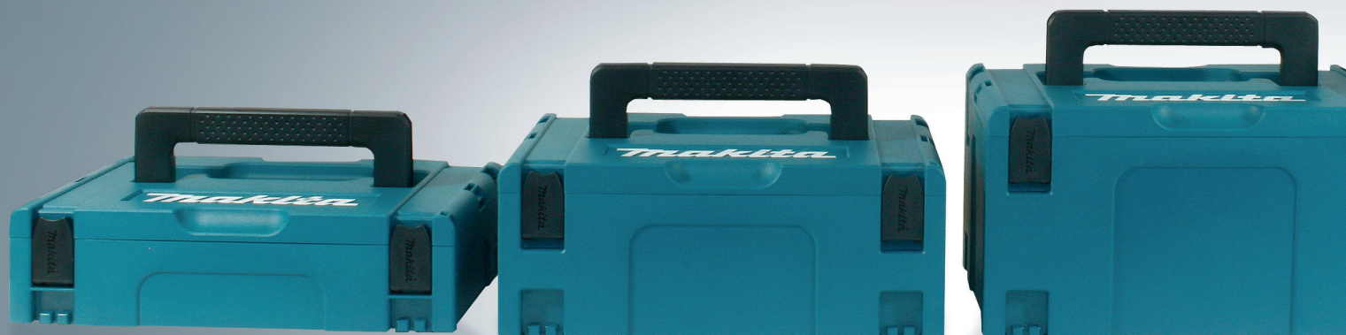
821549-5 (Tipo 1)

Il Vostro modo di organizzare il lavoro si accresce con maggiore efficienza nel trasporto delle vostre